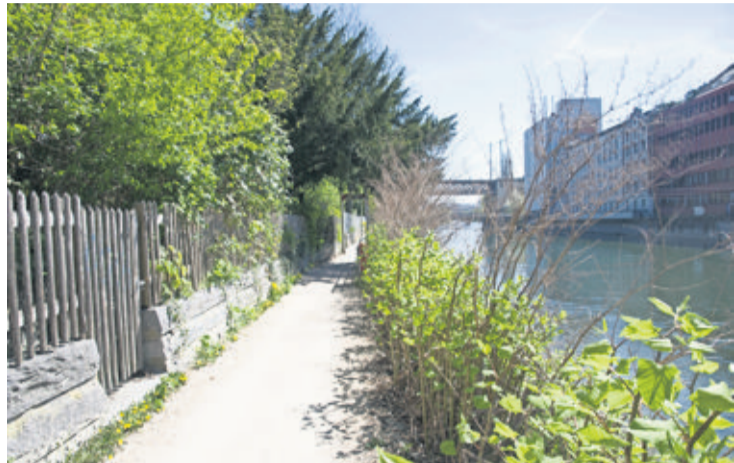
La renouée du Japon au bord de la Limmat, à deux semaines d'intervalle sans intervention.

Zurich déploie de gros moyens. Avec un budget de 350 000 francs, les autorités ont mis en place une stratégie déployée sur quatre piliers: information, coordination, contrôle et surveillance. Des cours de sensibilisation de la population ainsi que des journées d'actions seront organisées prochainement. «La procédure sera coordonnée avec les Municipalités voisines et le Canton. Le mode d'élimination le plus sûr est l'incinération des plantes dans une usine à déchets. Il faut