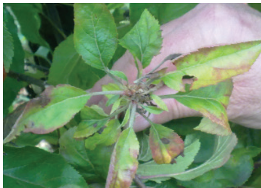
Figure 1 Symptômes de AP: "balais de sorcière"

Le phytoplasme de la prolifération du pommier, un pathogène important dans les vergers de pommiers européens.