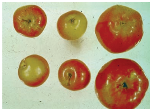
Figure 5 Fruits d'arbres sains à droite et infectés au centre et à gauche