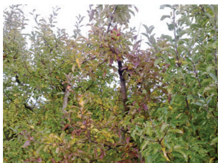
Figure 4 Symptômes de AP: "rougissement précoce des feuilles en été"