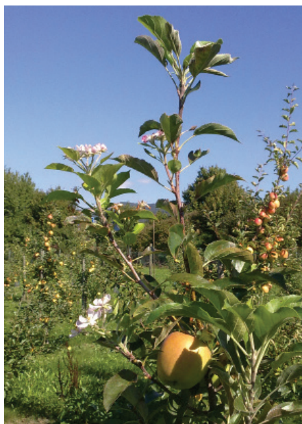
Figure 3 Symptôme de AP: "floraison secondaire en septembre"