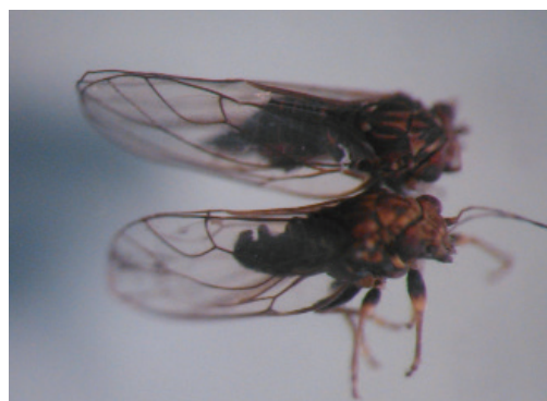
Figure 6 Individu femelle et mâle de Cacopsylla picta