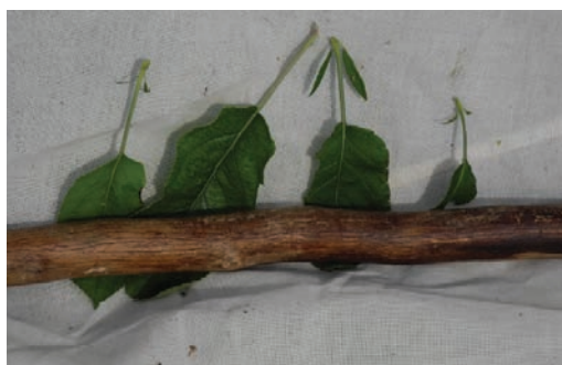
Figure 2 Symptômes de AP: "Stipules élargies"