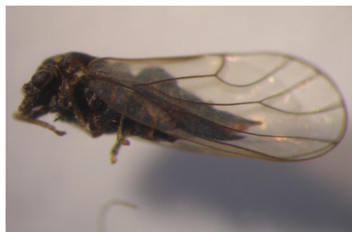
Figure 7 Individu femelle de Cacopsylla melanoneura